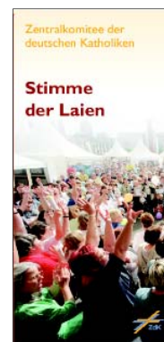
Zentralkomitee der dt. Katholiken: Stimme der Laien