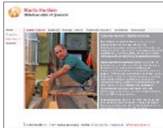
Möbelwerkstatt im Josefstal, Rainau www.im-josefstal.de

Konzeption und Text Internetauftritt, 2012