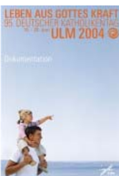
Zentralkomitee der dt. Katholiken: Leben aus Gottes Kraft. 95. Deutscher Katholikentag Ulm 2004

Dokumentationsband mit CD, 624 S., Butzon & Bercker 2005