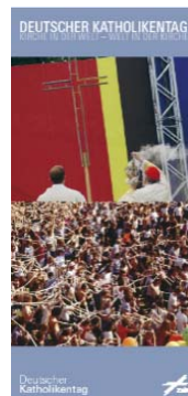
Deutscher Katholikentag: Kirche in der Welt – Welt in der Kirche

Dokumentationsband mit CD, 624 S., Butzon & Bercker 2005