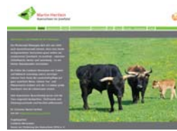
Auerochsen im Josefstal, Rainau www.aurochsen-im-josefstal.de

Konzeption und Text Internetauftritt, 2012