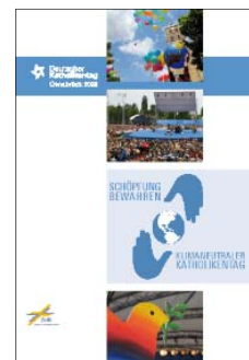
97. Deutscher Katholikentag Osnabrück 2008 e. V.: Schöpfung bewahren – Klimaneutraler Katholikentag

28 Ausstellungstafeln und Begleit- broschüre DIN A5, 48 S., 2012