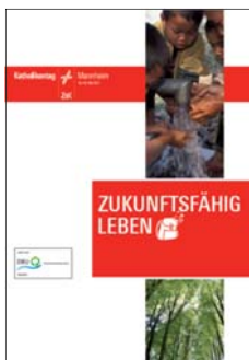
98. Deutscher Katholikentag Mannheim 2012 e. V.: Zukunftsfähig leben

Konzeption und Text Internetauftritt, 2013